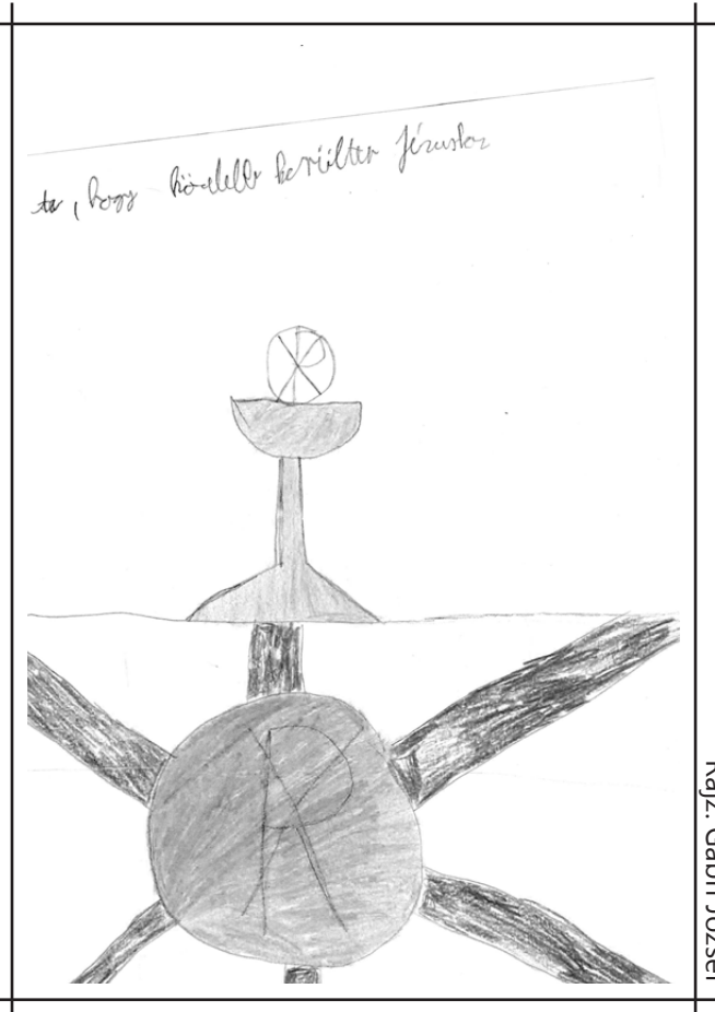
Rajz: Gábris József