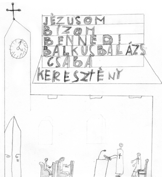
Rajz: Balkus Balázs Csaba