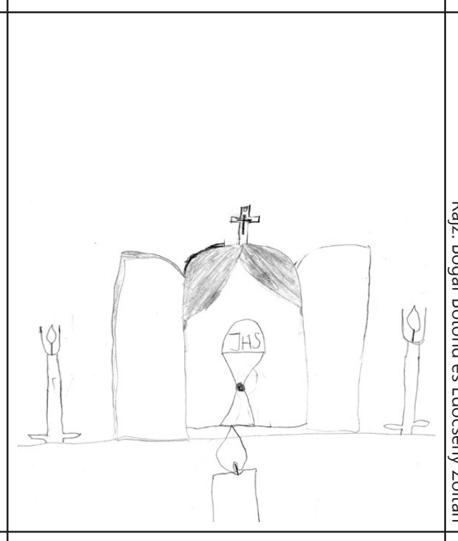
Rajz: Bogár Botond és Edöcsény Zoltán