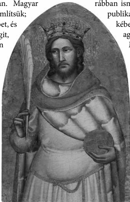
Niccolò di Pietro Gerini Szent Zsigmond, XIV. sz.

Az elméletet a fiatal történész, Horváth Illés tüze-