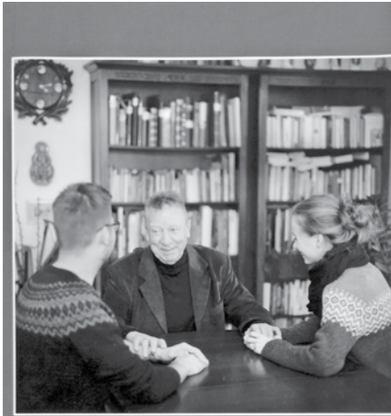
Egybeszerettél minket – Beer Miklós 80

Beer Miklós püspök atya az idén 80 éves. Érettségi tájékán döntött a papi hivatás mellett, és végigjárta az utat. Káplán, plébános, gyóntató-lelkiveze-tő, majd teológus oktató, aztán megyéspüspök, most végül „nyugdíjas”. Egy hosszú életet eltölteni egyházi szolgálatban csodálatos. Mit tett ezért? Nyitott volt a szólító isteni kegyelemre – és nyitott a mindenkori híveire. Isten talán legtöbbször a hívőkön keresztül szólt őhozzá, hívta, kérte a segítségét, a közre-működését – és közvetítette az Ő megszentelő kegyelmét.