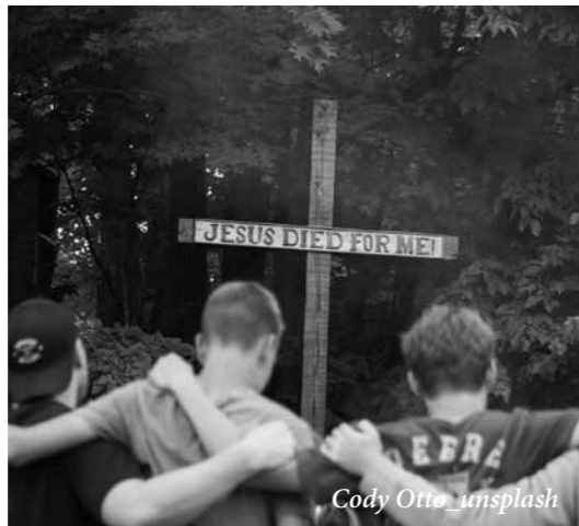
Cody Otto unsplash