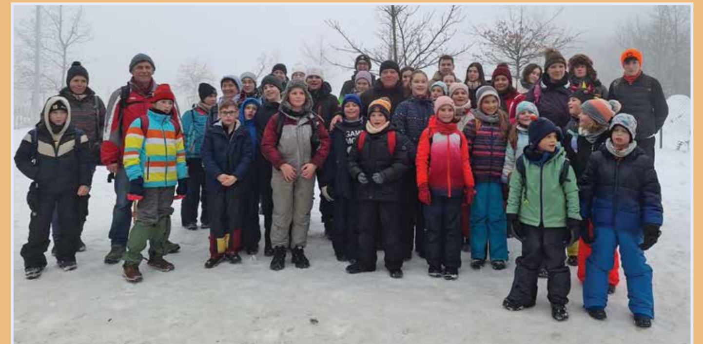
RORÁTÉS JUTALOMKIRÁNDULÁS 2026. FEBRUÁR 7.