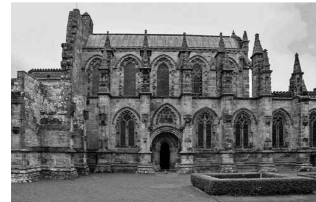
Roslyn-kápolna napjainkban, Skócia

A 2006-ban készült A Da Vinci-kód c. amerikai film próbálkozott a rejtély megfejtésére.