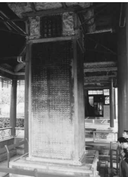
Hszian – a Kötáblák Erdeje Múzeumban