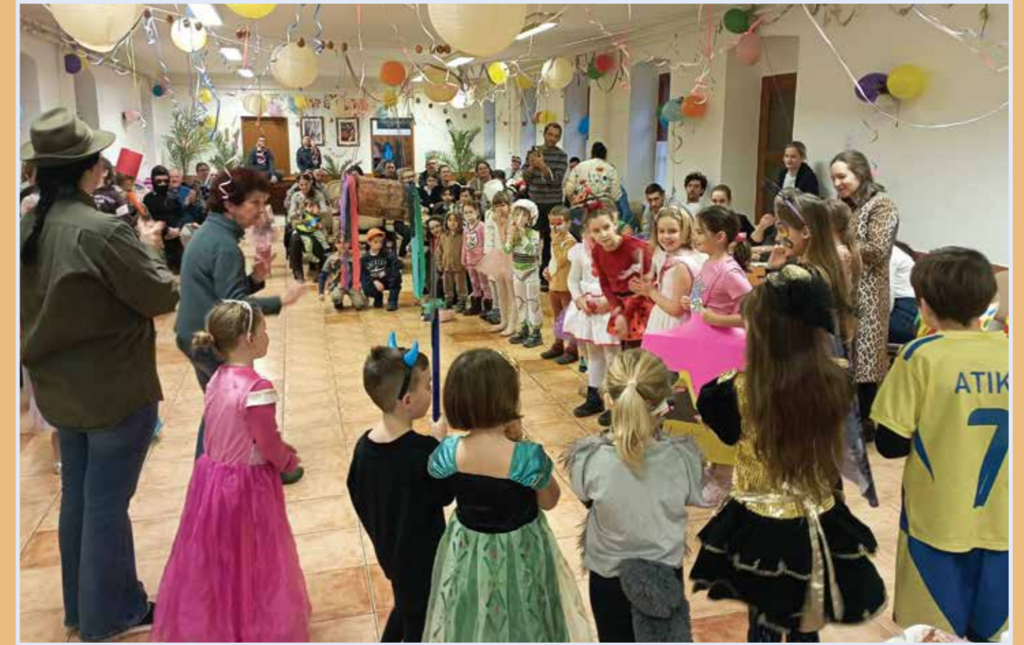
FARSANG 2026. JANUÁR 17.