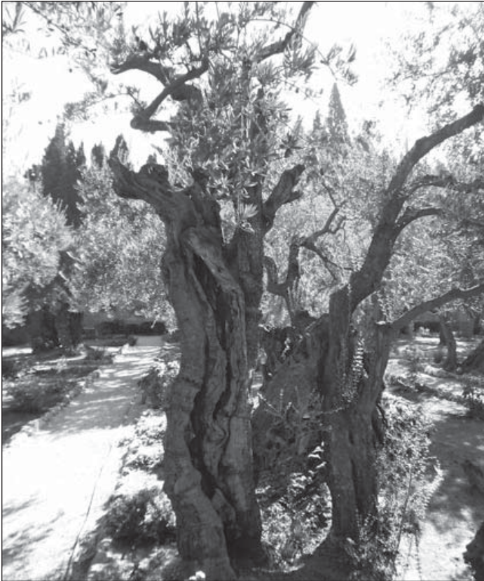
Olajfa a Getsemane kertben

Korom előre haladtával, és hitem erősödésével néha eljátszottam a gondolattal, milyen szép is lenne egyszer eljutni a Szentföldre, és lépkedni azokon a helyeken, ahol Jézus élt, tanított, csodákat művelt. Mivel kivitelezhetetlennek tartottam, nem is sokat töprengtem rajta.