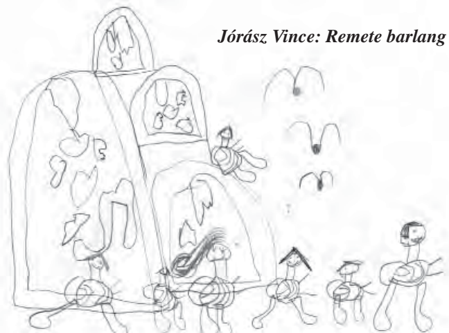
József Vince: Remete barlang

Köszönöm, hogy segítségére vannak az egyházi hozzájárulást szedő híveinknek, akik ezt a munkát évek óta nagylelkűen végzik ellenszolgáltatás nélkül.