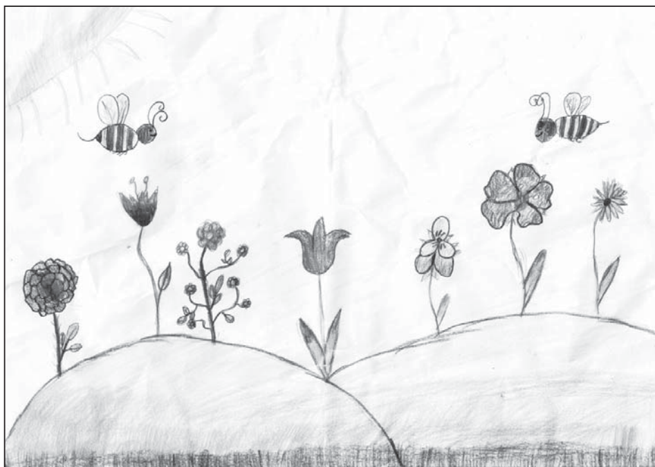
Baranyi Barbara rajza